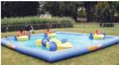
BATEAUX PADDLES : le Bassin Gonflable des Petits Pédalos du Mississipi