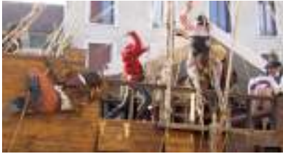
LES TERREURS DES MERS : Pirates sur la Ville