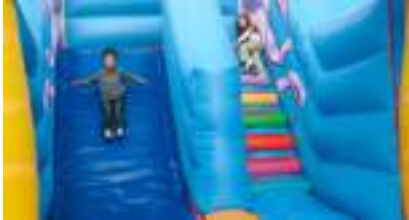
MONSTRES DE L'OCEAN