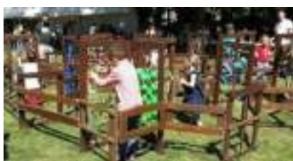
LABYRINTHE en BOIS Géant Grandeur Nature : le Dédale Sensoriel Pédagogique