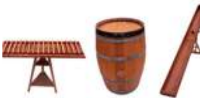
JEUX EN BOIS WESTERN