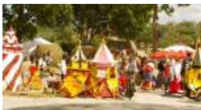
Le Petit Camp Médiéval des Beaux Jeux : LE VILLAGE DES CHERUBINS