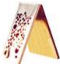
GRUYERE ET TROUS