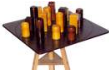
TABLE A ELASTIQUE