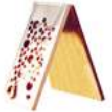
GRUYERE ET TROUS