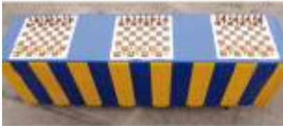
TABLE JEUX D'ECHECS