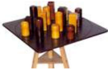
QUARTO CASSE-TETE STRATEGIE