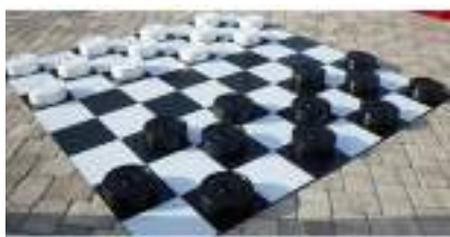
JEUX GEANTS Dames Mikado Puissance 4 : Stratégie et Adresse !