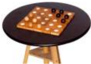
QUITO CASSE-TETE STRATEGIE