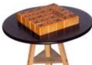
QUIXO CASSE-TETE STRATEGIE