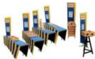
TOURNOI JEUX en BOIS PRESTIGE