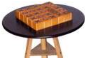
QUIXO CASSE-TETE STRATEGIE