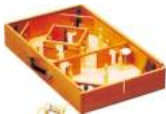
JEU DU ROI ET TOUPIE