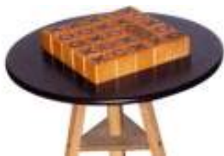
QUIXO CASSE-TETE STRATEGIE