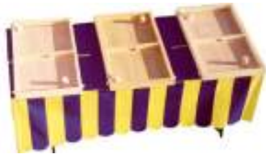
TABLE A ELASTIQUE