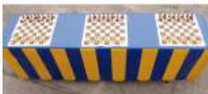
TABLE JEUX D'ECHECS