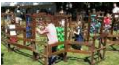
LABYRINTHE en BOIS Géant Grandeur Nature : le Dédale Sensoriel Pédagogique