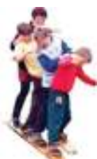
PLANCHES A SKI