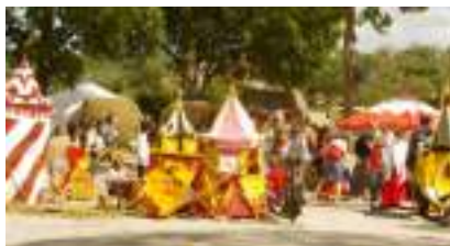
Le Petit Camp Médiéval des Beaux Jeux : LE VILLAGE DES CHERUBINS