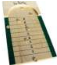
TUNE ET JETONS