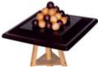
PYLOS CASSE-TETE STRATEGIE

Published on Monica Médias ( https://www.monicamedias.com )