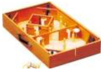
JEU DU ROI ET TOUPIE