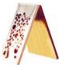
GRUYERE ET TROUS