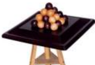
PYLOS CASSE-TETE STRATEGIE