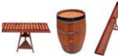
JEUX EN BOIS WESTERN