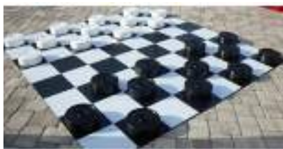
JEUX GEANTS Dames Mikado Puissance 4 : Stratégie et Adresse !