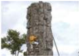
MUR D'ESCALADE 2