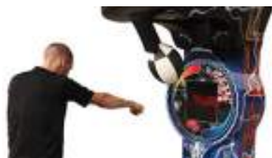
Simulateur de Boxe et KO : STAND COUP DE POING