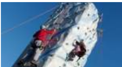
MUR DE GLACE