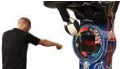
Simulateur de Boxe et KO : STAND COUP DE POING