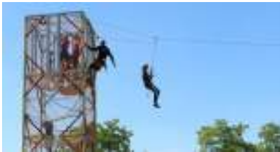
CAGE A GRIMPER avec TYROLIENNE