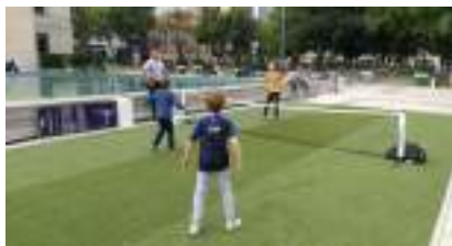
TENNIS BALLON : c'est de la Balle tout Foot !