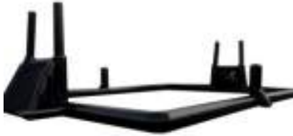
Terrain Multi Sport Football et Rugby : le beau Stade !