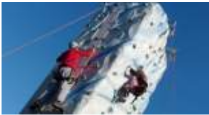
MUR DE GLACE

Published on Monica Médias ( https://www.monicamedias.com )