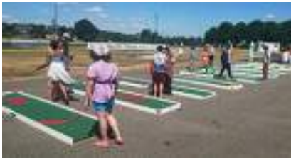
LOCATION MINI-GOLF : Parcours de Jeux 9 PISTES