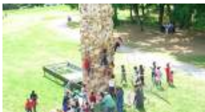
ROCHER MOBILE GEANT D'ESCALADE

Source URL: https://www.monicamedias.com/accrobranche-le-parcours-des-ouistitis.html