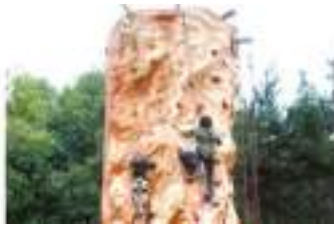
MUR ROCHER D'ESCALADE