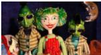
LA TERRE PERD LA BOULE : nature environnement et recyclage