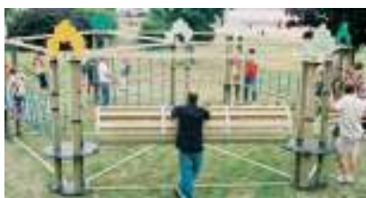
ACCROBRANCHE : le Parcours des Ouistitis !