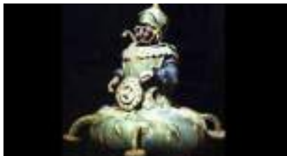
DROLES D'EXTRATERRESTRES : la chasse aux éléments