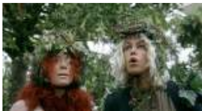
ECHASSIERS de la forêt : du Bio et Green 100% NATURE