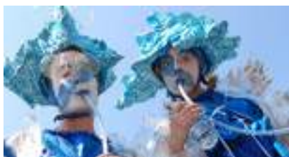
LES ECHASSIERS BLEUS fêtent l'Eau, la Terre et les Cieux