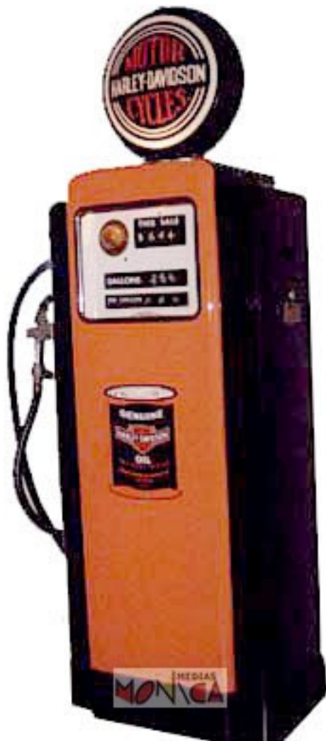
Pompe à essence Harley Davidson US