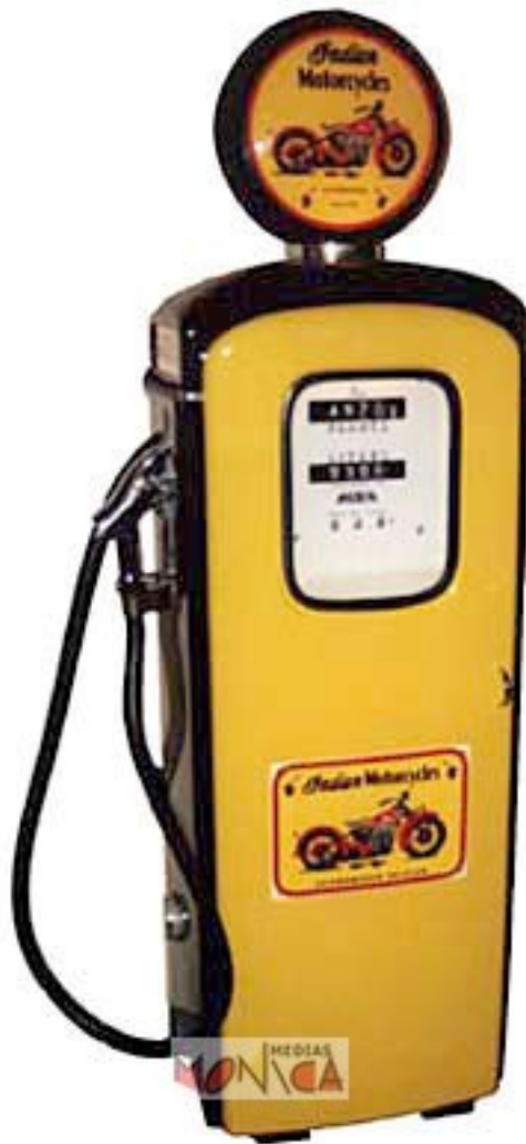
Pompe à essence MotorCycles US