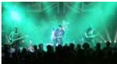
Orchestre NEW STONES: le Concert Rock Satisfaction