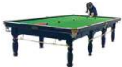
LOCATION SNOOKER BILLARD