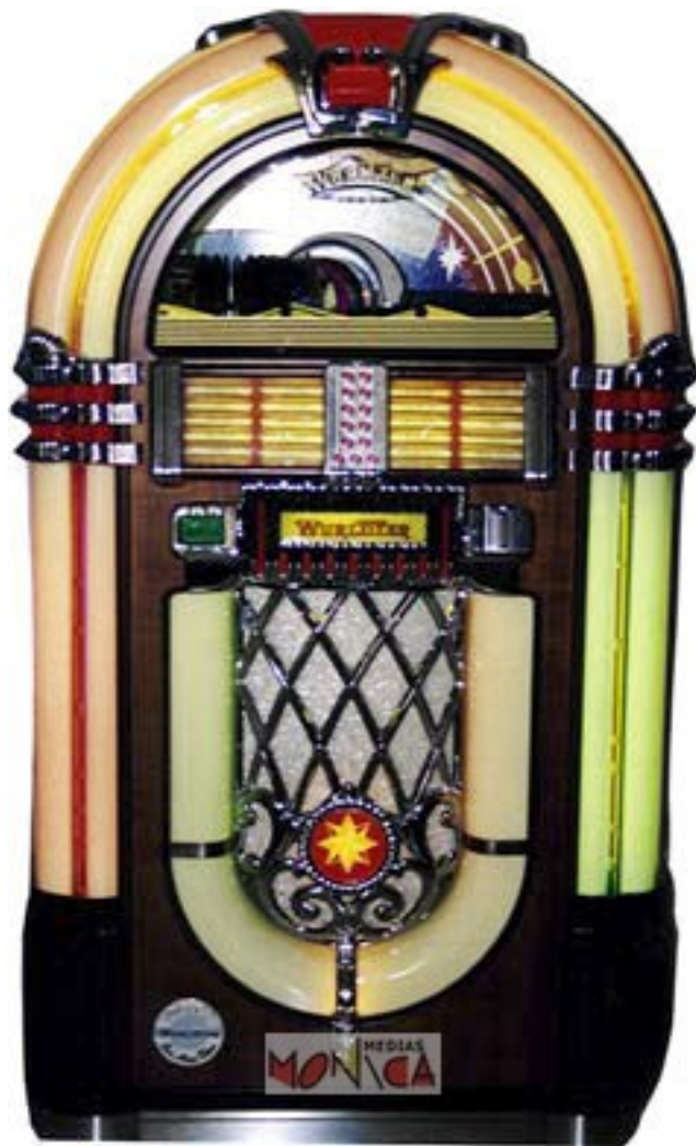
Juke-box CD Würlitzer