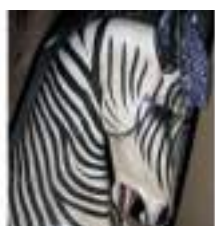
DECO AFRIQUE 1