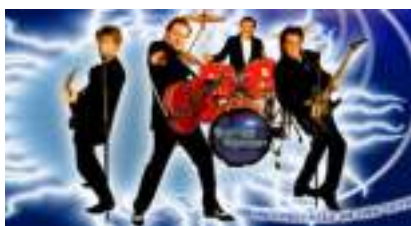
Orchestre SIXTIES ROCK : le show des Années 60