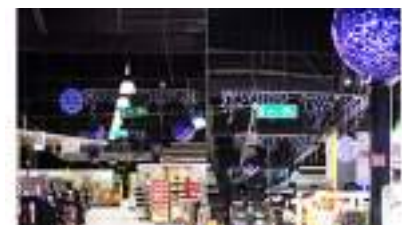
DECORATION DE NOEL Magasin Hyper ou Grande Surface