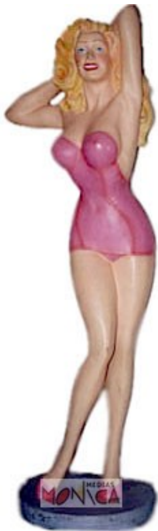
Statue en résine Marilyn, Elvis, James Dean, Blues Brothers, Serveuse US, etc...