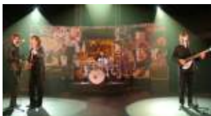
Orchestre NEW BEATLES : groupe dans le Vent REWIND