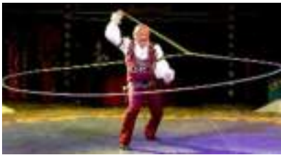
BOB LE SHERIF : Lasso Révolvers et Fouets