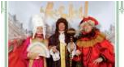
STUDIO PHOTO ROI SOLEIL VERSAILLES LOUIS XIV : le Photocall de Luxe, Noblesse oblige !