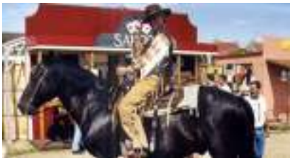
SHOW CALAMITY MISS WEST