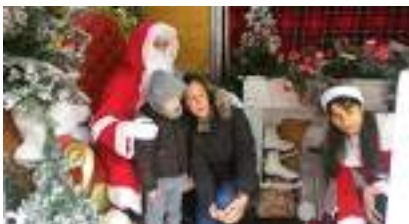
CHALET du PERE NOËL avec BORNE PHOTO TRÔNE et HÔTESSE