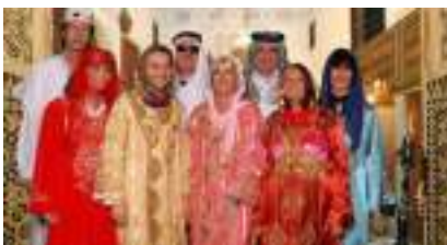
STUDIO PHOTO ORIENTAL