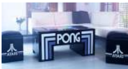
PONG ATARI : Location de Tables Design de Jeux Vidéo