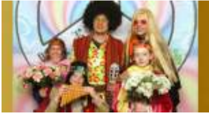
STUDIO PHOTO SEVENTIES 70' Baba Cool Hippie Flower Power