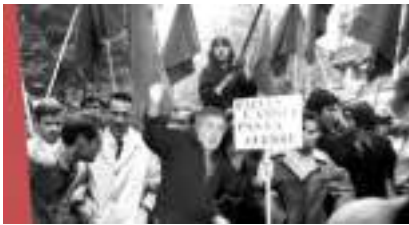
STUDIO PHOTO MAI 68 QUARTIER LATIN BARRICADES PARIS REVOLUTION