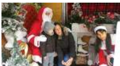
CHALET du PERE NOËL avec BORNE PHOTO TRÔNE et HÔTESSE

Source URL: https://www.monicamedias.com/animation-photo-disco-shooting-studio-summer-night-fever.html