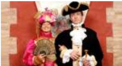
STUDIO PHOTO VENISE CARNAVAL