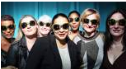
ANIMATION BORNE PHOTOCALL VINTAGE DISCO PHOTOBOOTH SUR FOND VERT

Source URL: https://www.monicamedias.com/animation-photo-disco-shooting-studio-summer-night-fever.html