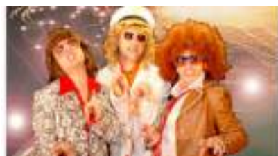
LES JETSETTEURS : people VIP à Saint Tropez