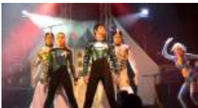
SHOW STAR TREKKERS Galaxie_SF