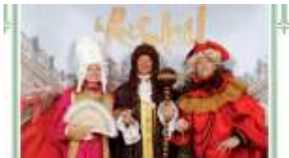
STUDIO PHOTO ROI SOLEIL VERSAILLES LOUIS XIV : le Photocall de Luxe, Noblesse oblige !