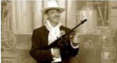
STUDIO PHOTO PROHIBITION : Chicago et l'Incorruptible Al Capone