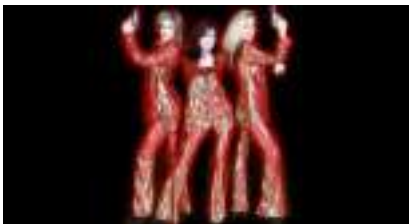
SHOW SEXY ANGELS Top Models