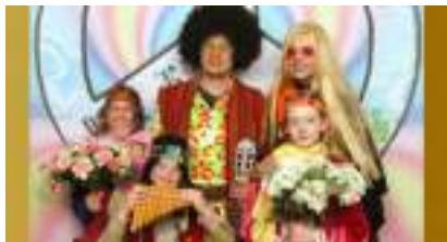
STUDIO PHOTO SEVENTIES 70' Baba Cool Hippie Flower Power