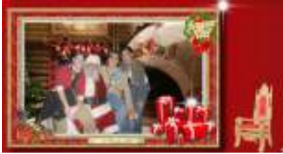
STUDIO PHOTO PERE NOEL sur Fond Vert