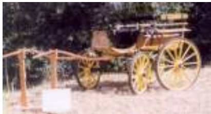
ATTELAGE BREAK WAGONNETTE 1930