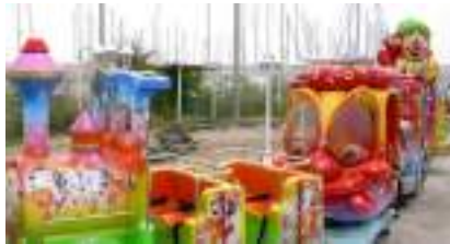
Le PETIT TRAIN FUN du CARNAVAL à CLOWNS