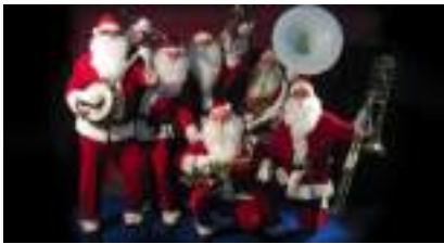
LES PERES NOËL MUSICIENS

Published on Monica Médias ( https://www.monicamedias.com )