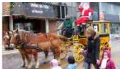
OMNIBUS 3/4 A L'IMPERIALE