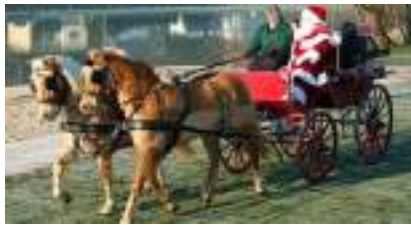
WAGONNETTE ALSACIENNE 1900