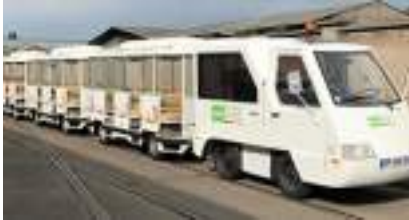
LE PETIT TRAIN ELECTRIQUE ROUTIER à louer : Ecologique et Touristique !