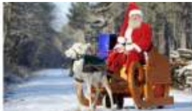
L'EQUIPAGE DU PERE NOEL Traineau Lutin et Renne