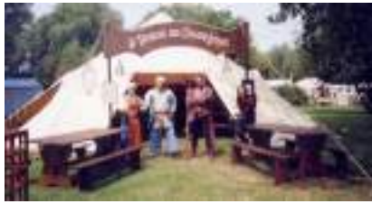
STANDS PIRATES Jeux de Marins