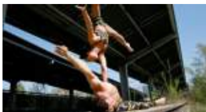
FOCUS MAIN A MAIN