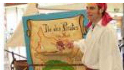
LE TRESOR DU PIRATE : chariot spectacle pour jeux d'aventure