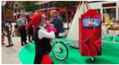
LE MANEGE PIRATE à PEDALES : ECOLO MUSICAL et CREATIF