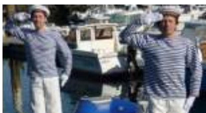
LES ECHASSIERS MARINS : géants des mers et des mares