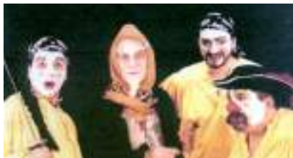
LE BAL DES PIRATES