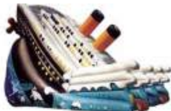
TOBOGGAN TITANIC GONFLABLE