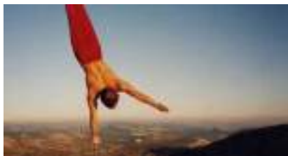
L'Acrobate qui se joue de l'Equilibre et des... Décors !