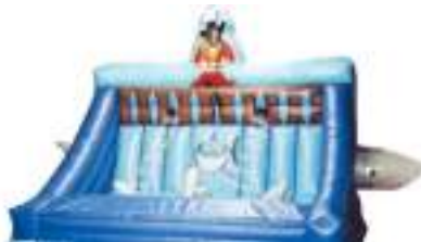
ECHELLES DU PIRATE GONFLABLE