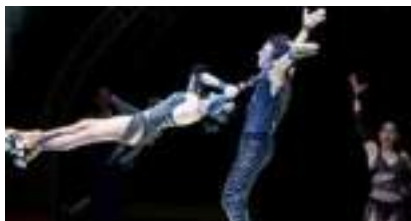
PATINS VOLTIGE A ROULETTES