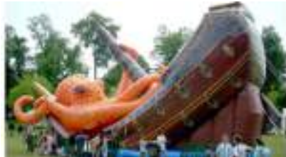
TOBOGGAN du GALION à la PIEUVRE GEANTE GONFLABLE