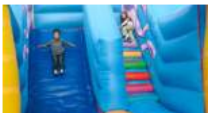
MONSTRES DE L'OCEAN