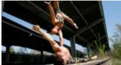
FOCUS MAIN A MAIN