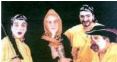
LE BAL DES PIRATES