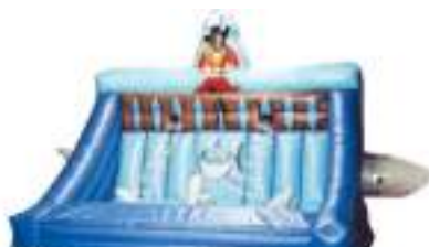
ECHELLES DU PIRATE GONFLABLE