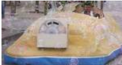
Char à Bulles sonorisé de l'Îlot des Pirates