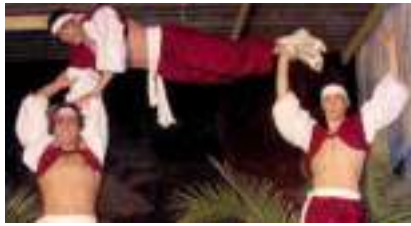
ACROBATIE EQUILIBRE ET PYRAMIDES