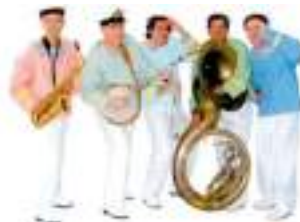
MARINS JAZZY MOUSSES