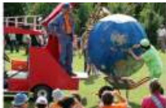
POINT D'EAU Planète Terre