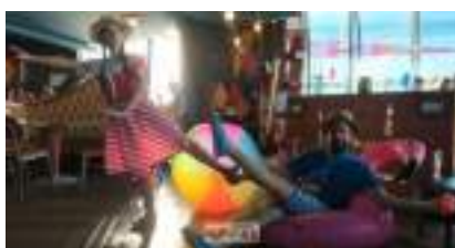
BORD DE MER : Artistes Glaces à l'Eau pour Vacanciers Estivaux très Beaux !