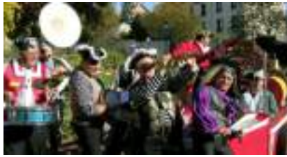
LA FANFARE DES CORSAIRES