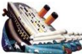
TOBOGGAN TITANIC GONFLABLE