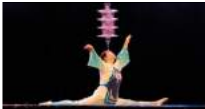
VERRES EN EQUILIBRE