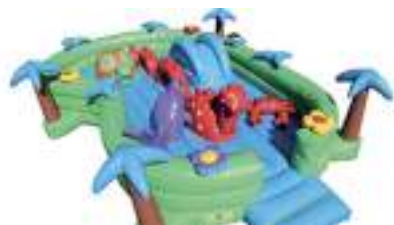
LE LAC AU SERPENT DE MER GONFLABLE