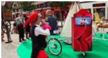
LE MANEGE PIRATE à PEDALES : ECOLO MUSICAL et CREATIF