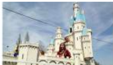
le CHAR DU CHATEAU de la Belle au Bois Dormant