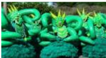
LA PARADE DES PIEUVRES GEANTES The Octopus Ballet