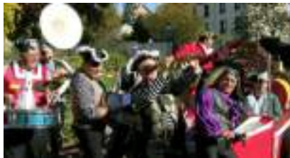
LA FANFARE DES CORSAIRES