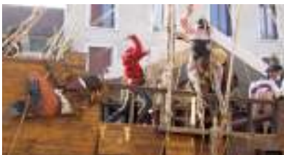
LES TERREURS DES MERS : Pirates sur la Ville