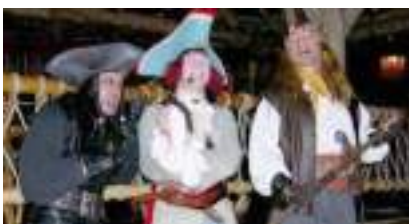
LA FLIBUSTE RIT