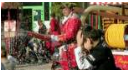
Le CHAR des PIRATES avec CANON CONFETTIS : les Pompiers Corsaires !