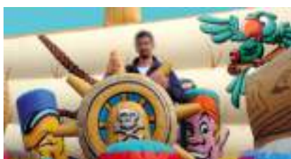
LES PIRATES DES CARAIBES