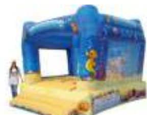
FONDS MARINS GONFLABLES