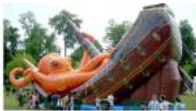
TOBOGGAN du GALION à la PIEUVRE GEANTE GONFLABLE