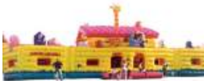
ARCHE DE NOE GONFLABLE