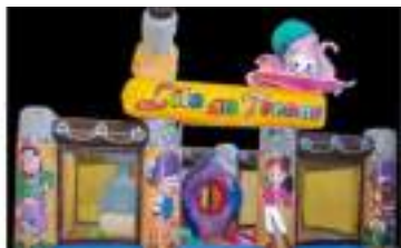
L'ILE DU POULPE AU TRESOR