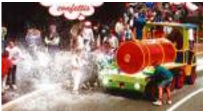
LOCOMOTIVE à CONFETTI : le Char de Carnaval mène Grand Train