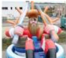
LA ROUE DU PIRATE GONFLABLE