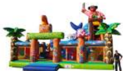
RODEO PIRATE sur REQUIN GONFLABLE