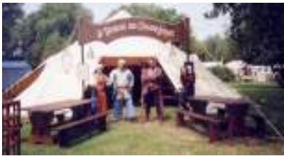
STANDS PIRATES Jeux de Marins

Published on Monica Médias ( https://www.monicamedias.com )