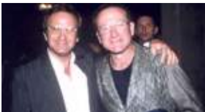
SOSIE ROBIN WILLIAMS