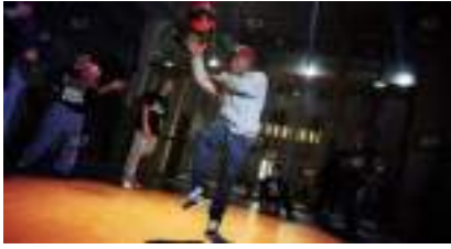
Basket Freestyle : le jeu de ballon qui se démarque!