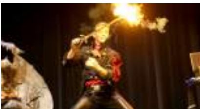
SPECTACLE MAGIE PRESTIGE