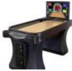
LOCATION SUPER SHUFFLE BOWLING électronique sur Table