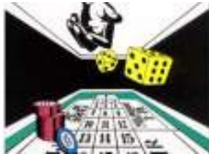
SOIREE CASINO SICBO dés chinois