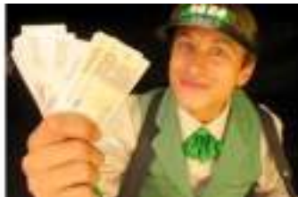
LES RIEN NE VA PLUS : casino poker et tricheurs