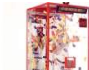
CABINE A BILLETS