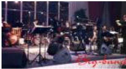
FANFARE du CINEMA en B.O. : l'Orchestre Blues Brothers Blockbuster