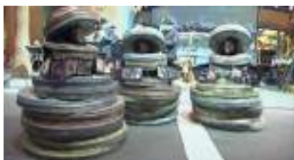
LES EMBOBINEURS DE FESTIVAL