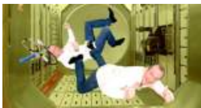
STUDIO PHOTO SCIENCE FICTION FX EFFETS SPECIAUX

Source URL: https://www.monicamedias.com/studio-photo-cinema-stars-festival-hollywood.html