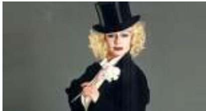
SOSIE MARLENE DIETRICH