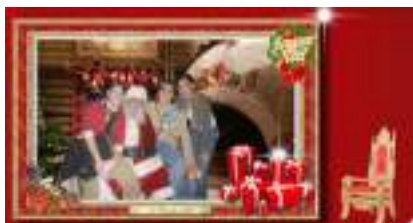
STUDIO PHOTO PERE NOEL sur Fond Vert