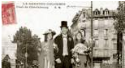
STUDIO PHOTO 1900 Rétro Belle Epoque Guinguette : le Photocall des Années Folles