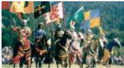
PRINCE NOIR au TOURNOI ROYAL