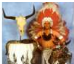
CRAZY SNAKE Chef indien charmeur de Serpents