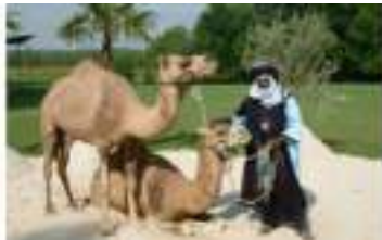
LA CARAVANE PASSE : défilé d'animaux d'Orient