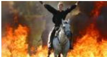
LE WESTERN FAIT SON CINEMA Dressage et Acrobaties