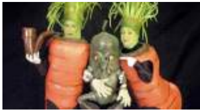
LES CAROTTES SAUTEES : légumes pour fantaisie bio