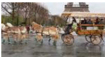
CALECHE de NOËL ou d'ETE GRANDE WAGONNETTE