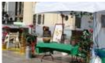
DEGUSTATION POMME AU JUS