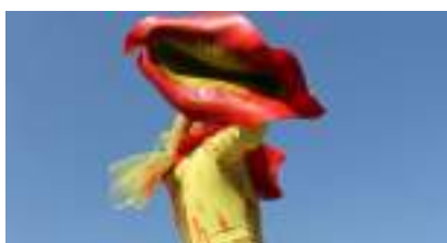
LES CREATURES DE LA JUNGLE