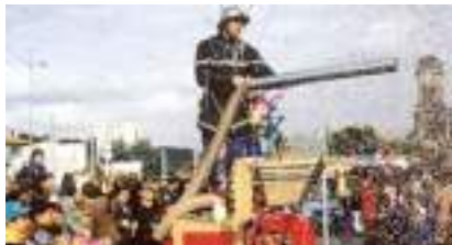
CHAR DES POMPIERS CONFETTIS