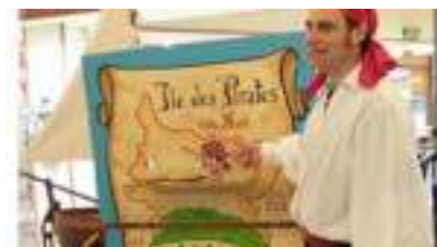
LE TRESOR DU PIRATE : chariot spectacle pour jeux d'aventure