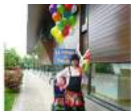
LE CHARIOT A MAX : Ballons Sculptés pour Parade et Défilé