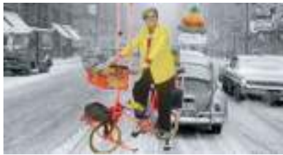
SOLO EN BICYCLETTE : le clown VTT musical à gags