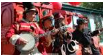
LA LOCOMOTIVE à MUSIQUE, SKETCHES ET BULLES : le Petit Train Rouge Rock West !