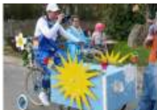
LE TRIPORTEUR A TROMPETTE : musique, bulles et ballons

Source URL: https://www.monicamedias.com/mecanique-et-bulles-machine-infernale-sur-char-velo.html