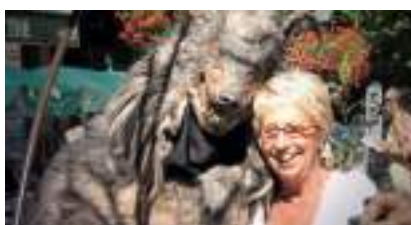
LE GRAND MECHANT LOUP ROCKEUR : comme un chien enragé d'amour