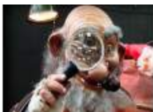
LES CHASSEURS DE FAUX PERES NOEL : Renne et Lutin Détectives