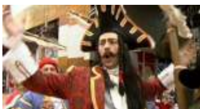
Comédiens Pirates et artistes improvisateurs des Mer : LES ECHOUES !