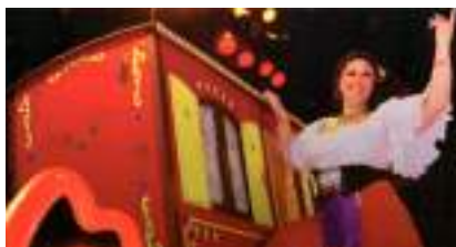
ROULOTTE ENCHANTEE et LIGNES de la MAIN : gitane ou tzigane l'ambiance du cirque a une âme