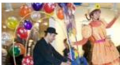
LA PARADE VELO CIRCUS : Triporteur sonorisé pour Rires et Ballons sculptés