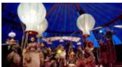
Anticipation pour montgolfières : LES AVENTURES DES FOUS VOLANTS