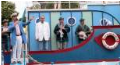
LE BATEAU DES VILLES : Théâtre de l'Eau