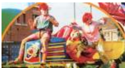
CHAR TURBO CLOWN : moteur musical pour carnaval