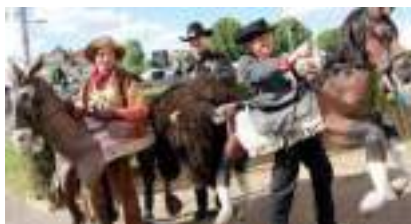
BALADE AU FAR WEST : duel pour bison et shérif