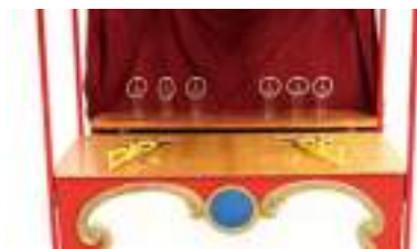
TIR AUX BOUTEILLES DE SODA : les Kids du Far West