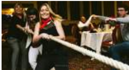
JEU DU TIR A LA CORDE