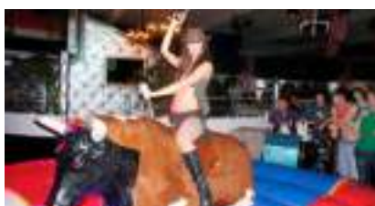
TAUREAU MECANIQUE en Location : Animation Rodéo Western