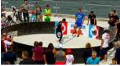
L'Arène Football : le Terrain "Street Soccer" des Duels au Ballon Freestyle