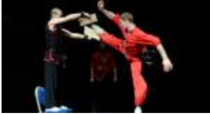
KUNG-FU Arts Martiaux Chinois en démonstration