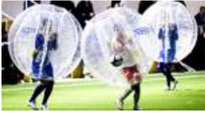
Football en Bulles : des Bubbles, des Ballons et des Buts