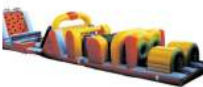
SUPER DEFI GONFLABLE

Source URL: https://www.monica medias.com/plongeon-aerien-de-haut-vol-se-plonger-dans-un-spectacle-extreme-sans-se-mouiller.html