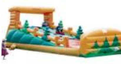
PISTE DE LUGE GONFLABLE