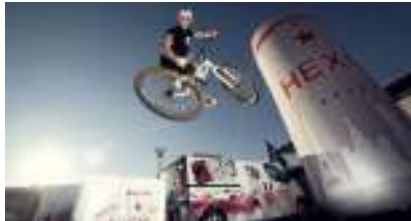
VTT Trial : le spectacle de vélo qui colle à la roue !