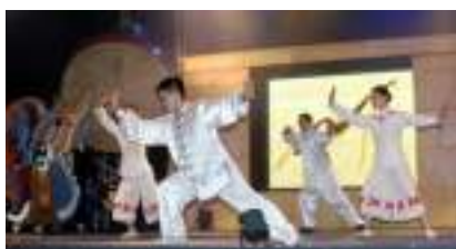
TAI-CHI-CHUAN : Animation Démonstration de l'Eternelle Jeunesse !