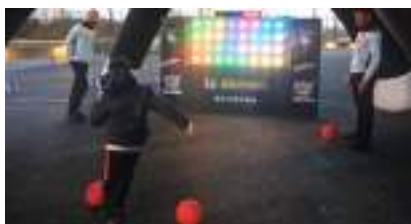
MUR DIGITAL FOOTBALL : l' Animation Multisports Numérique !