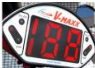
Tir au But et au Radar : l'Animation Football qui vous met au Ballon