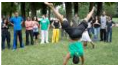
Capoeira Show : danse et art de combat, le cocktail sportif brésilien en Initiation et Démonstration !