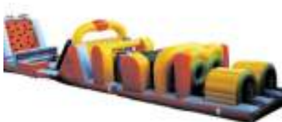
SUPER DEFI GONFLABLE