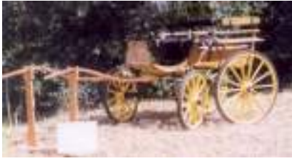
ATTELAGE BREAK WAGONNETTE 1930