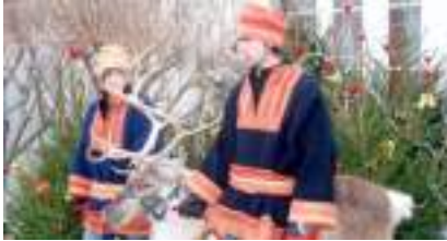
LES RENNES DE NOËL : le Traîneau direct de Laponie

Source URL: https://www.monicamedias.com/manchots-pour-la-banquise.html