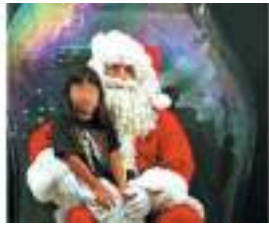
PHOTO BULLE DE NOEL