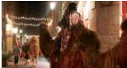
LES ROIS MAGES Contes et Promenades