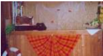
DECO BRESIL 2