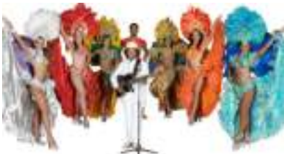
BRASILIA CARNAVAL RIO GIRLS