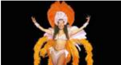
SAMBA RIO DANSE SHOW