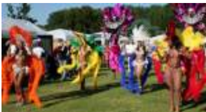
CARNAVAL RIO SHOW