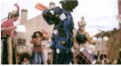
LES ECHASSIERS MUSICIENS : le théâtre des géants de la rue