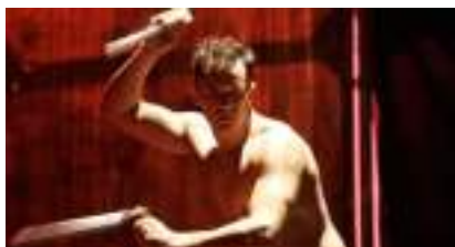
KING KUNG FU SHOW : les Arts Martiaux top niveau