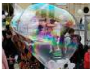
Le Clown Infernal et sa Machine à très grosses Bulles de Savon !