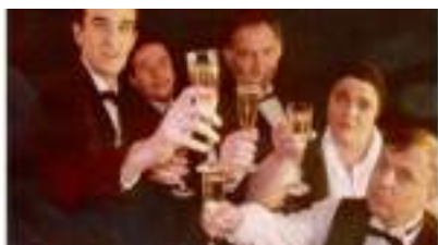
Faux Serveurs : la folle soirée des PIQUE-ASSIETTES