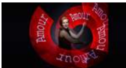
La JONGLEUSE de Lumières et Logos