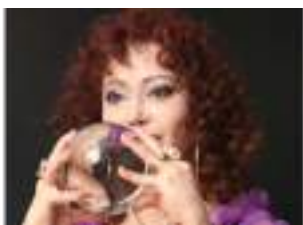
LA VOYANTE MAGICIENNE : boule de cristal, tarot et colombes