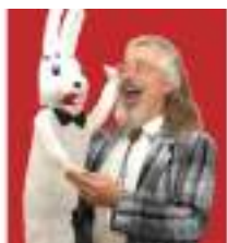
LE VENTRILOQUE MARIONNETTE et le LAPIN HUMORISTE