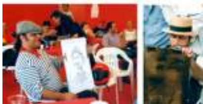
CARICATURISTES COSTUMES DE PARIS