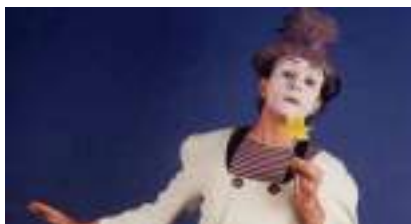
MIME SUIVEUR Tendre et Comique