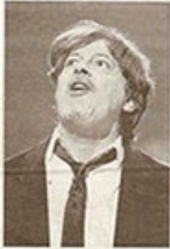
De la folie douce à l'in vraisemblable possible.

Comédien et humoriste français, Eric Thomas est devenu au fil des années un maître de la folie douce. Artiste rendu célèbre par l'émission de Guy Lux « La Classe » il entraîne inégalement les spectateurs dans un univers loufoque. Il arrive à faire croire voire admettre que tout est normal même ce qui est le plus invraisemblable. Eric mime, bruite, observe, traque, dépèce, passe en revue tous les instants de vie avec la précision d'un métronome. Mais surtout il est doté d'une machine à paroles qui débite les mots et construit les phrases plus vite que le cow-boy solitaire ne dégaîne ; c'est peut être ! Des caricatures de multiples situations il en fait du vécu et tout ce qui est dring devient plausible. Eric Thomas fait partie de ceux qui considèrent qu'une journée sans rire est une journée perdue.