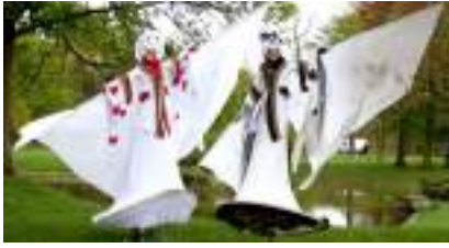
ECHASSIERS DE VENISE: le Carnaval Sérénissime