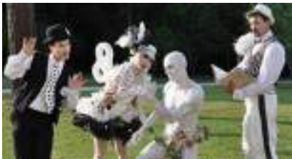
LES ECHASSIERS MAGNIFIQUES de la BELLE EPOQUE des ANNEES FOLLES !

Source URL: https://www.monicamedias.com/echassiers-costumes-sur-mesure.html