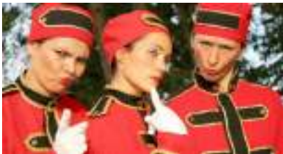
LES GROOMS ECHASSIERS: chasseurs de luxe pour Conciergerie Etoilée, Cocktails et Accueil