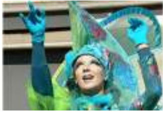
LES FLEURS SUR ECHASSES : Bouquet de Femmes Végétales au Parfum