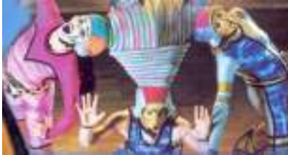
LES ECHASSIERS HIGH-TECH : le futur à pas de géants