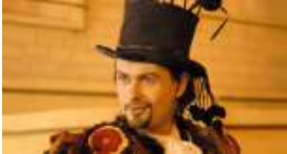
LE DANDY ECHASSIER : romantisme en mode humour de rue