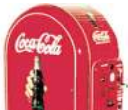
DECO ANNEES 60 SIXTIES USA 2 : Coca Cola, Rock Ola, Texaco