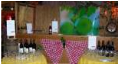
DECO PROVENCE 1