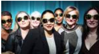
ANIMATION BORNE PHOTOCALL VINTAGE DISCO PHOTOBOOTH SUR FOND VERT