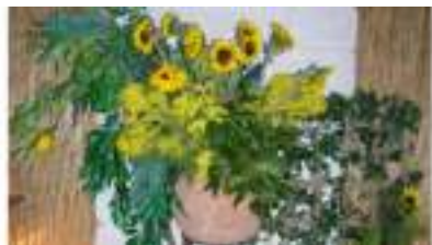
DECO PROVENCE 2