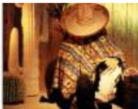
DECO WESTERN 1