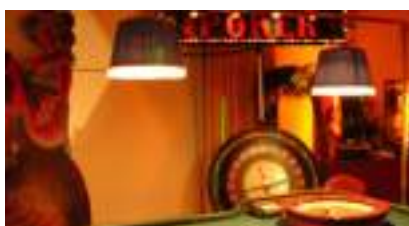
DECO LAS VEGAS CASINO 1