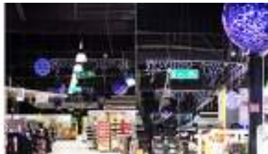
DECORATION DE NOEL Magasin Hyper ou Grande Surface