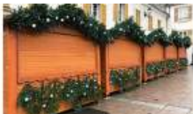
DECORATION CHALETS avec SAPINS et GUIRLANDES pour MARCHE DE NOËL