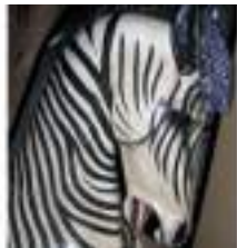
DECO AFRIQUE 1