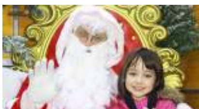
ANIMATION PHOTO PERE NOËL BORNE PHOTOBOOTH TRÔNE ET SAPIN