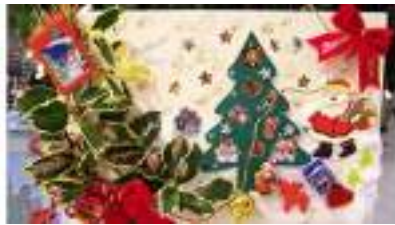
ATELIER PLAQUES FESTIVES DE NOEL