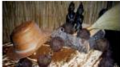
DECO AFRIQUE 2