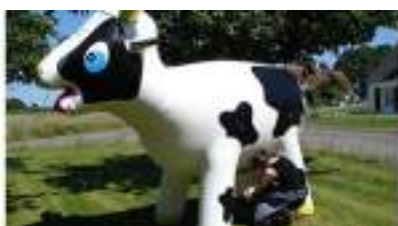
JEU de la VACHE à TRAIRE et à BOIRE qui RIT !