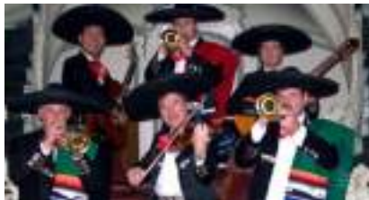
GROUPE MARIACHIS TEQUILA : Danseuses et Orchestre des Trompettes et Violons de la Fiesta Mexicaine !