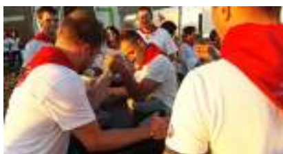
JEU DU BRAS DE FER