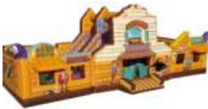
LE GRAND SALOON DU FARWEST