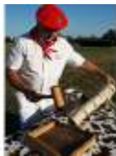
JEU DU CASSE NOIX