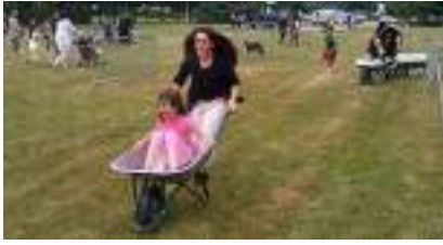
JEU DE LA COURSE DE BROUETTES

Published on Monica Médias ( https://www.monicamedias.com )