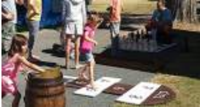
JEU DE LA MARELLE