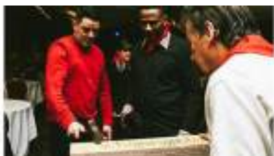
JEU DE LA POINTE