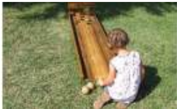
MINI BOWLING DES TROIS MAGOTS