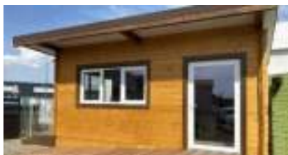
Kiosque Commercial Pliable en Bois pour Stand, Bureau, Jardin, Marché