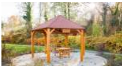
KIOSQUE de Luxe : le Chalet Gloriette en Bois à Ouverture Totale !