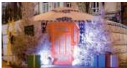
YOURTE TRADITIONNELLE en location

Published on Monica Médias ( https://www.monicamedias.com )