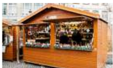
CHALET de marché de NOËL 4 mètres facile et rapide à monter en location ou vente

Source URL: https://www.monicamedias.com/chalet-en-bois-sapin-3-metres-x-250-location-