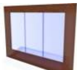
FACADES et AUVENTS pour CHALET de NOEL