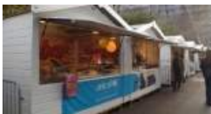
CHALETS NOEL DOUBLES TRIPLES: les Plus Grands Espaces de vos Marchés et Foires