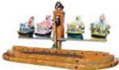
MANEGE ROCK N ROLL CIRCUS