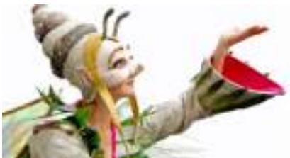
LES ECHASSIERS MINUSCULES: dans un Jardin Fantastique et Nature