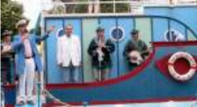
LE BATEAU DES VILLES : Théâtre de l'Eau