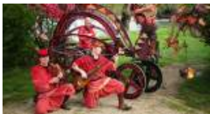
Le DRAGON MEDIEVAL et MUSICAL: Fantastique Chariot de Feu pour Concerts Héroïques !