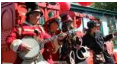
LA LOCOMOTIVE à MUSIQUE, SKETCHES ET BULLES : le Petit Train Rouge Rock West !