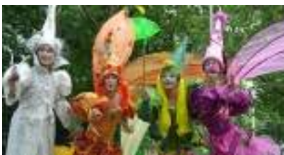
Les FEES d'Amour MULTICOLORES sur ECHASSES