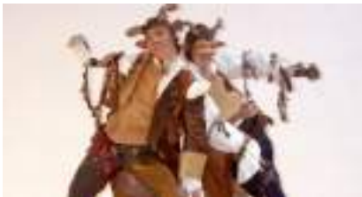
Parade échassière des bois : LA FORÊT DES GEANTS VERTS