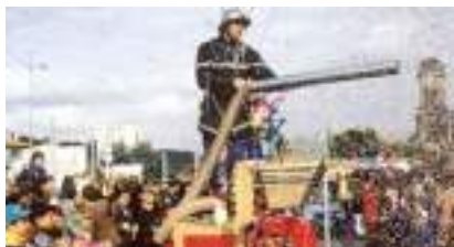
CHAR DES POMPIERS CONFETTIS