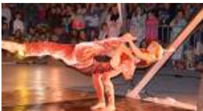
Les Acrobates de la Forêt Enchantée