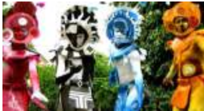
SORCIERS ECHASSIERS DU SOLEIL: danseurs indiens des Amériques