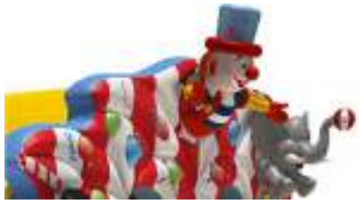
LE CIRQUE MAGIQUE GONFLABLE