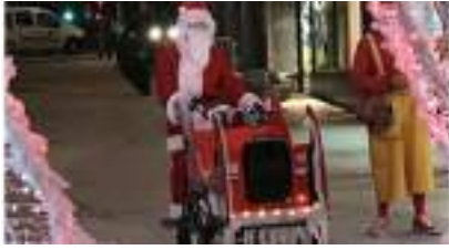
Le Traîneau du Père Noël en triporteur sonorisé lumineux