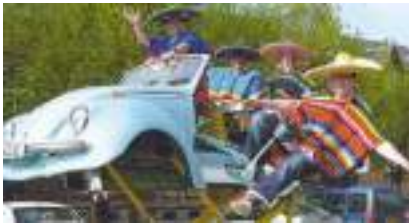
VOITURE CHAR : la Pitchoune Mexicaine