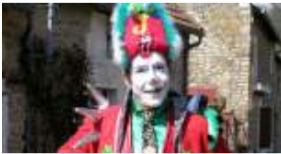
Le MIME CLOWN et sa MARIONNETTE magique en triporteur musical