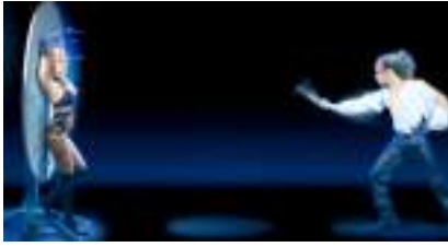
Lanceur de couteaux : FINE LAME & CIBLE VIVANTE