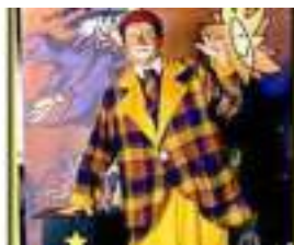
GUIGNOL A ROULETTES : clown musicien et magicien mobile