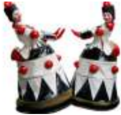
JOUETS GEANTS ECHASSIERS : cadeaux de Noël lumineux et animés !