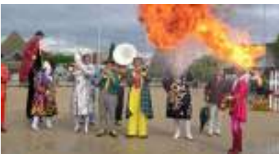
C'EST LA PARADE DU CIRQUE ! Jongleur Cracheur Clown et Monsieur Loyal...