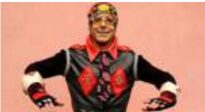
MIME SUIVEUR GAGMAN : pop art de rue