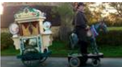
LE CARROUSEL LIBERE : suivez ce manège