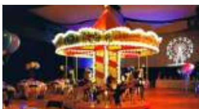
MANEGE CARROUSEL DES CHEVAUX de BOIS du CIRQUE