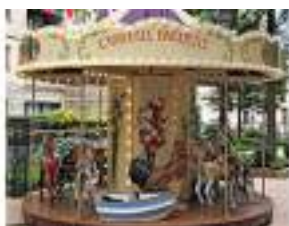
LE MANEGE CARROUSEL DU JARDIN DE BAGATELLE