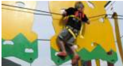
PARCOURS AVENTURE ACROBATIQUE