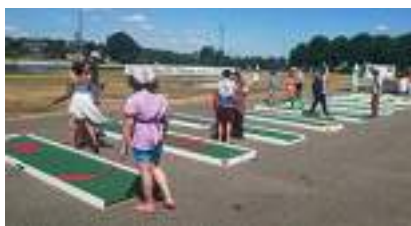
LOCATION MINI-GOLF : Parcours de Jeux 9 PISTES