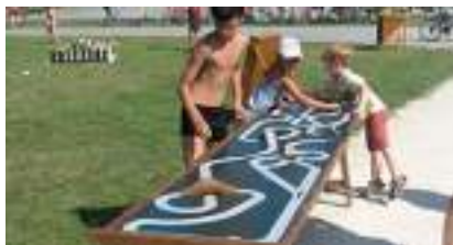
JEU DU CIRCUIT DE BILLES