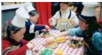
LA PETITE FABRIQUE : initiation petite enfance à la Création Manuelle