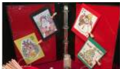
ATELIER CARTES DE VŒUX