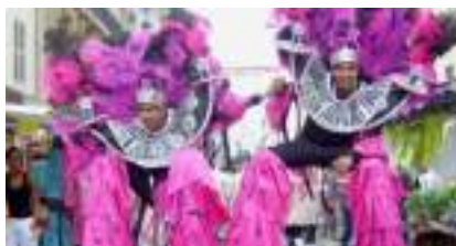
SAMBA DANSE sur ECHASSES : les Géants du Carnaval Brésilien !