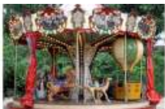
MANEGE LA MARSEILLAISE