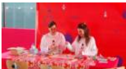
PATE A MODELER: l'atelier Fimo