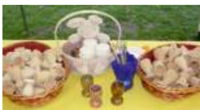
ATELIER LAPINS ET OEUFES DE PÂQUES