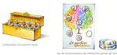
ATELIERS PARFUMES : fleurs odeurs senteurs