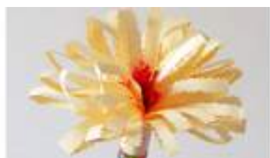
ATELIER CREATION DE FLEURS TRICOLORES EN PERLES PLUMES OU PAPIER CREPON