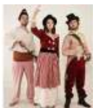
LES CITOYENS DE LA GRANDE REVOLUTION : le Tiers-Etat est dans la Rue