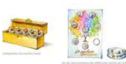
ATELIERS PARFUMES : fleurs odeurs senteurs