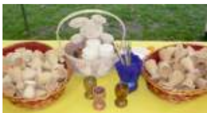
ATELIER LAPINS ET OEUF DE PÂQUES