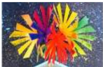
ATELIER CARTE POP UP FEU D'ARTIFICE