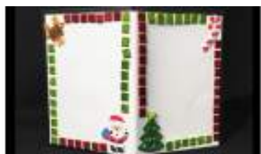
ATELIER CADRE PHOTO Noël et Réveillons