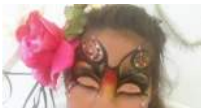
ATELIER COIFFURES VEGETALES : Cheveux en Fleurs