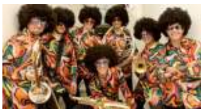
FANFARE DISCO FUNK : l'Orchestre Chic des Seventies