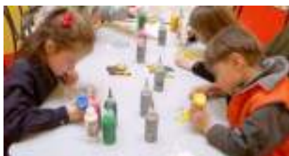
ATELIER DECOR DE VITRES