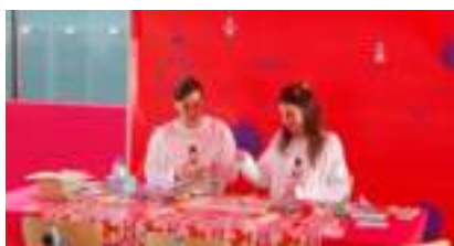
PATE A MODELER: l'atelier Fimo