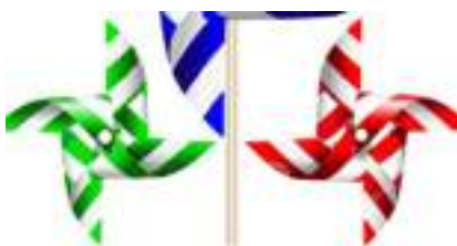
ATELIER MOULINS A VENT TRICOLORES