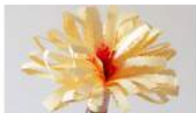
ATELIER CREATION DE FLEURS TRICOLORES EN PERLES PLUMES OU PAPIER CREPON