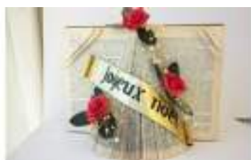
ATELIER DES LIVRES SAPINS