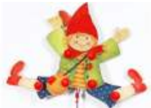
ATELIER LUTIN ET PÈRE NOËL