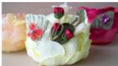
ATELIER PHOTOPHORES DE NOËL