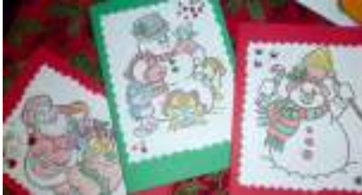
NOËL CRÉATIF: sapin étoile boule et carte de Noël