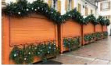
DECORATION CHALETS avec SAPINS et GUIRLANDES pour MARCHÉ DE NOËL