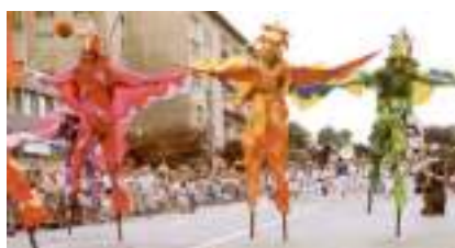
OISEAUX DANSEURS ECHASSIERS: Vol Rio Brésil Direct