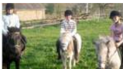
PONEYS en LOCATION pour BALADES