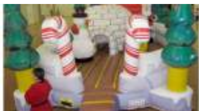
LE VILLAGE DU PERE NOEL