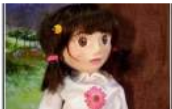
PAULINE ET LES ARBRES MAGIQUES