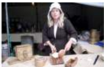
DEGUSTATION DU LAIT AU BEURRE