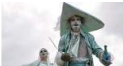
LES ECHASSIERS PIRATES des Mers et SIRENES des Coeurs