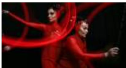
LES ECHASSIERES ELECTRIQUES : coups de foudre!