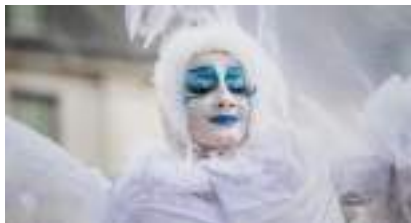
Echassières REINES des NEIGES de Noël et FEES Blanches Lumineuses de GLACE !