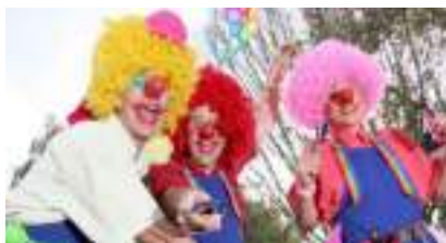
LES CLOWNS ECHASSIERS RELOOKEURS : le Pressing Relooking en Couleurs