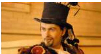
LE DANDY ECHASSIER : romantisme en mode humour de rue