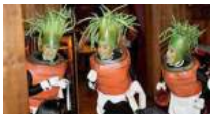
LES SERVEUSES CAROTTES : grosses légumes très organiques