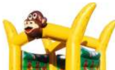
CHATEAU GONFLABLE SINGE