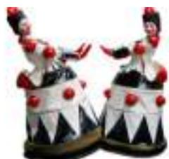
JOUETS GEANTS ECHASSIERS : cadeaux de Noël lumineux et animés !