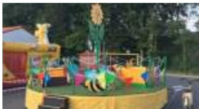
MANEGE ECOLO VELO du JARDIN printanier ensoleillé !