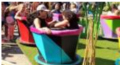
MANEGE ECOLOGIQUE CONTES ET LEGENDES