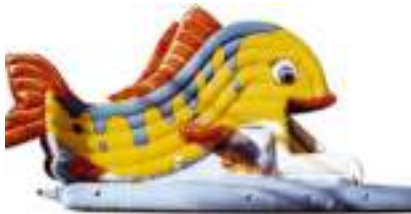
POISSON TROPICAL GONFLABLE