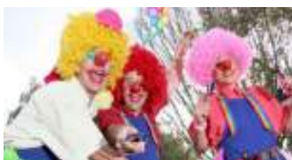
LES CLOWNS ECHASSIERS RELOOKEURS : le Pressing Relooking en Couleurs