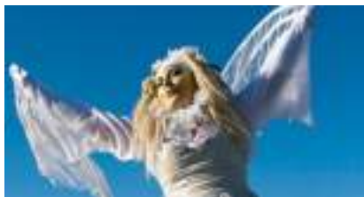
Blancs échassiers musicaux des neiges éternelles: LE PEUPLE DES MONTAGNES !