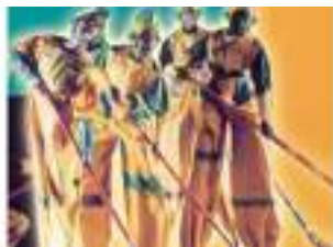
BALAYEURS ECHASSIERS: nettoyeurs et chorégraphes