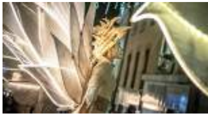
ECHASSIERS Blancs Lumineux Musicaux de Noël