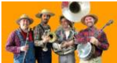
JAZZ AU NATUREL : l'Orchestre des Jardiniers des Campagnes à la Main Verte