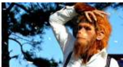
Les Très Grands SINGES : Planète Echasses