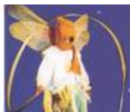
INSECTES GEANTS ECHASSIERS: ailes de lumières