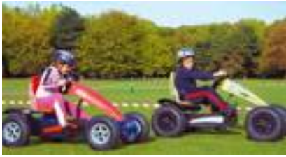
LES SHUTTLES CARS