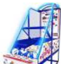
SIMULATEUR BASKET BALL de TIR ou LANCER au PANIER électronique