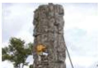
MUR D'ESCALADE 2