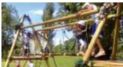
PARCOURS TRIPODE TYROLIENNE : l'Aventure Forestière Aérienne