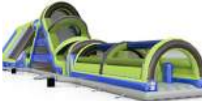
PARCOURS CHALLENGER TOBOGGAN GONFLABLE