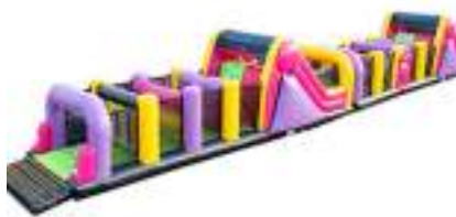
PARCOURS ENERGIE RUN GONFLABLE