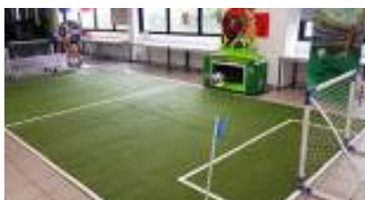
TIR AU BUT FOOTBALL KICKER ELECTRONIQUE