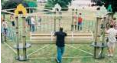
ACCROBRANCHE : le Parcours des Ouistitis !