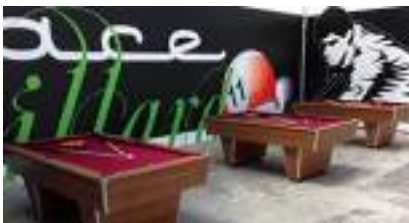
BEAUX BILLARDS DESIGN de LUXE en location