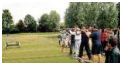
BALL TRAP LASER