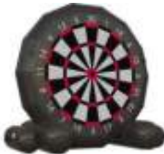
Cible Géante Rugby Double Dart Foot