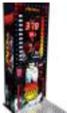
SIMULATEUR de BOXE : jeu de FORCE électronique