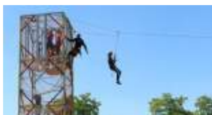
CAGE A GRIMPER avec TYROLIENNE