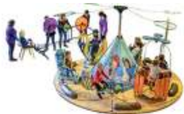
MANEGE ECOLO AVENTURE à pédales