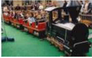
MANEGE PETIT TRAIN EXPRESS