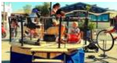
Le MANEGE ECOLO Rétro à la Roue de Vélo !