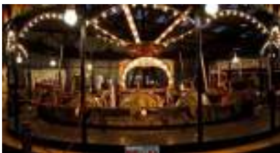
Le Manège Carrousel Vélocipède Authentique 1890