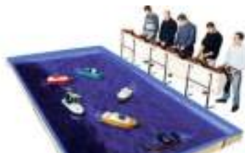
BASSIN pour BATEAUX RADIOCOMMANDES