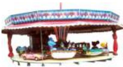
LOCATION MANEGE ATTRACTION