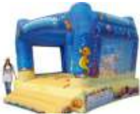
FONDS MARINS GONFLABLES