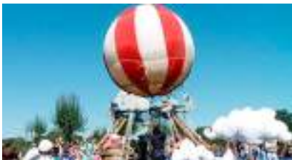
Le Manège Ecolo Musical du TOUR DU MONDE en BALLON

Source URL: https://www.monicamedias.com/le-manege-pirate-pedales-ecolo-musical-et-creatif.html