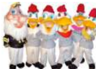
L'EQUIPAGE TOONS BD Bateau