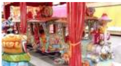
PETIT TRAIN sur RAIL de CONTES et LEGENDES

Source URL: https://www.monicamedias.com/le-manege-pirate-pedales-ecolo-musical-et-creatif.html