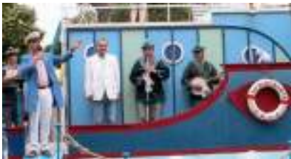
LE BATEAU DES VILLES : Théâtre de l'Eau