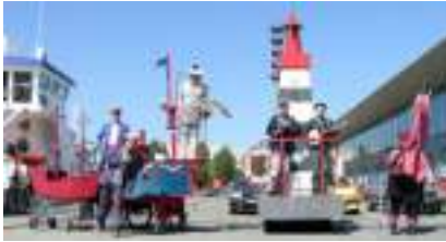
Le PHARE MOBILE : flots de Jazz pour chants de Marins et Mouettes !