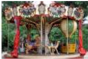
MANEGE LA MARSEILLAISE