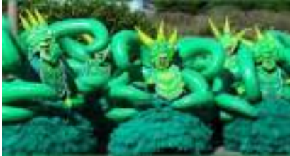
LA PARADE DES PIEUVRES GEANTES The Octopus Ballet