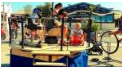
Le MANEGE ECOLO Rétro à la Roue de Vélo !