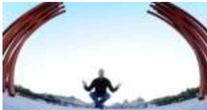
Slackline Highline: la corde souple, c'est vraiment raide !