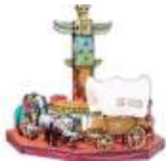
MANEGE WESTERN TOTEM