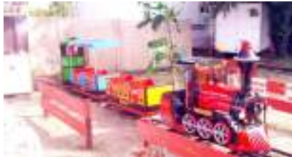
AUTHENTIQUE MINI TRAIN SUR RAIL