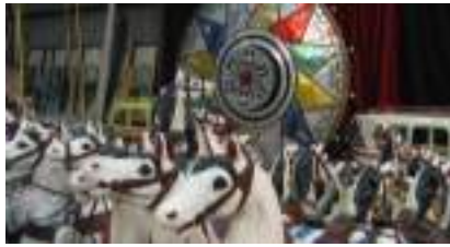
Décoration de Manèges, Chevaux, Voitures, Roue de Loterie et Jeux Forains