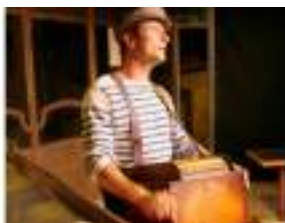
ORGUE de BARBARIE en spectacle : acteur et musicien de rue