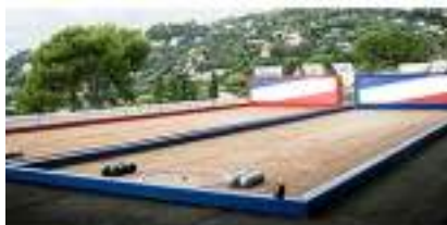
LOCATION TERRAIN DE PETANQUE ET BOULE