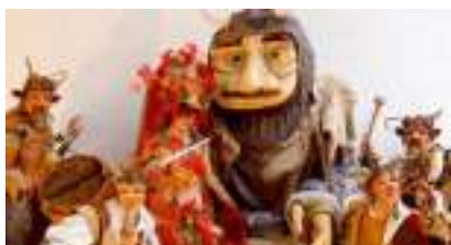
Echasses des bois en musique : LA FORÊT DES GEANTS