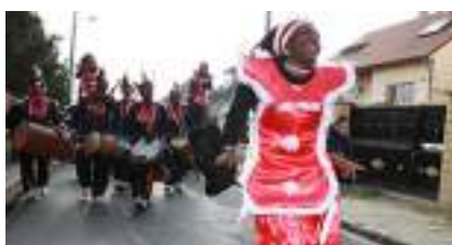
LES DIABLES ROUGES AFRICAINS : Tambours, Echasses et Danses en Transes