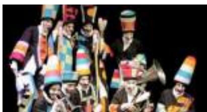
LES ECHASSIERS RIGOLOS : spectacle de rue en couleurs