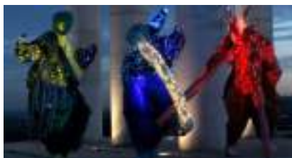
LES FRERES LUMIERES SUR ECHASSES