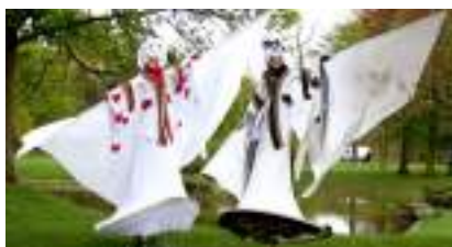
ECHASSIERS DE VENISE: le Carnaval Sérénissime