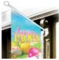
Drapeaux de Façade des Fêtes de Pâques