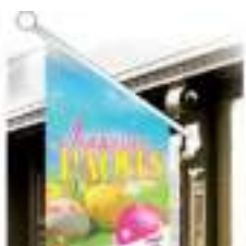
Drapeaux de Façade des Fêtes de Pâques