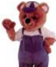
L'OURS EN PELUCHE