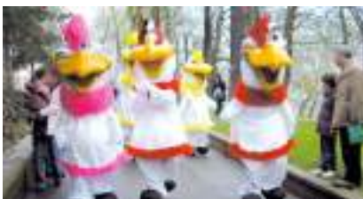
LA BRIGADE COCOTTES des Oeufs en Chocolat