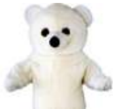
OURS BLANC PELUCHE