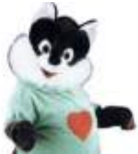
RENARD EN PELUCHE