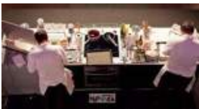
Animation Culinaire Gourmande avec Chef Cuisinier et Cuisine Mobile : SHOW DEVANT!