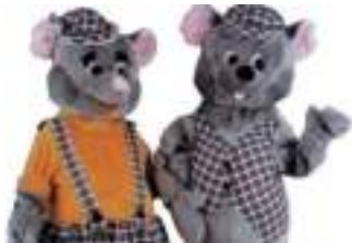
SOURICEAUX EN PELUCHE