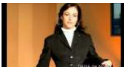
Organisation de Défilé de Mode FASHION STARS

Source URL: https://www.monicamedias.com/les-annees-folles-au-music-hall-chicago-et-prohibition.html