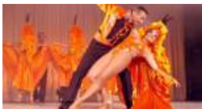
SOIREE CABARET PARIS Champs-Élysées