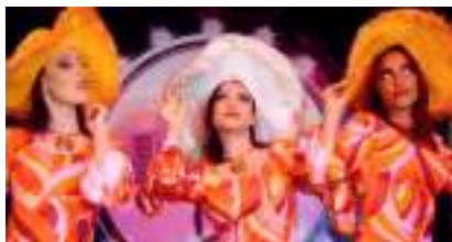
LA CITE DES ANGES : LES GRANDS SUCCES DU MUSIC-HALL