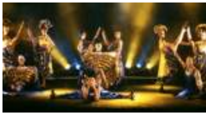
SOIREE CABARET REVUE MUSIC HALL : le Spectacle LOVE et numéros GLAMOUR PARADISE