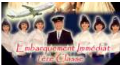
EMBARQUEMENT 1ère CLASSE : JEU SPECTACLE TOUR DU MONDE